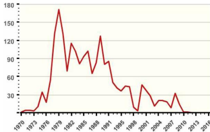
Az ETA merényleteinek a száma 1970 és 2016 között

nem tehetek fel keresztkérdéseket a vád tanúinak és nem kérdőjelezhetik meg a hatóságok által felmutatott – nem egy esetben a fogvatartottakból kínzással kicsikart – vallomások hitelességét. 20